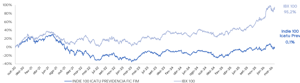
Performance (desde o início)