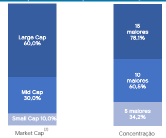
Carteira por market cap e concentração (1)