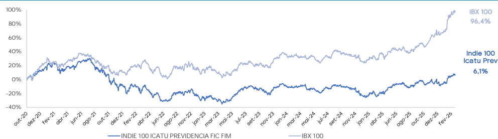
Performance (desde o início)